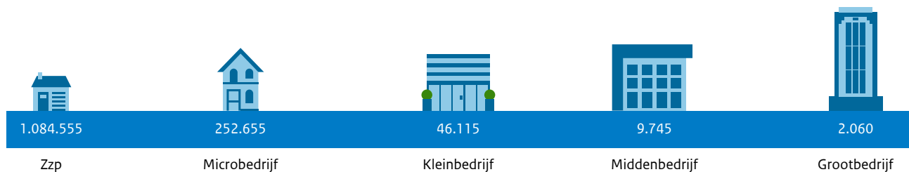
Figuur 1.1: Aantal bedrijven. Periode 4 e kwartaal 2022.